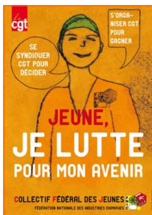
En direction des Jeunes