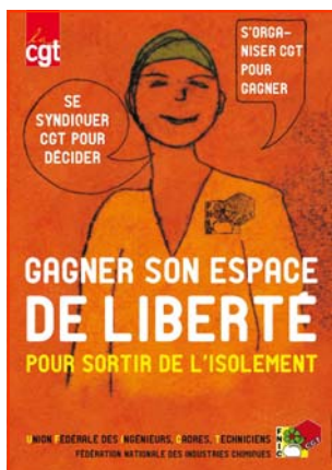
En direction des UFICT