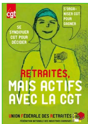
En direction des Retraités